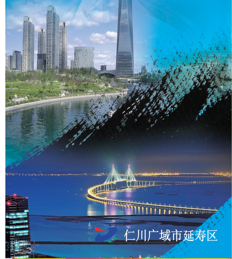
仁川广域市延寿区